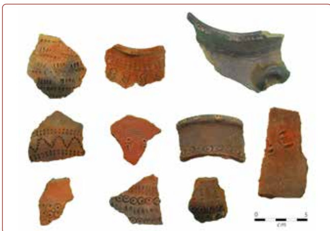
Figura 6. Fragmentos de cerámica de estilo Casma Inciso.