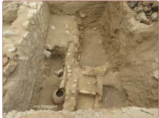
Figura 3. Unidad de Excavación 3D-Ampliación Norte mostrando la superposición arquitectónica temprana y tardía.

arqueológico que incluye arquitectura, basurales, viviendas y zonas de cementerios. El sitio está constituido por una serie de terrazas y plataformas antropogénicas donde se construyeron múltiples conjuntos arquitectónicos. En la temporada 2019, nuestros trabajos de campo se enfocaron en una cercadura de piedra ubicada en la parte sur del sector San Isidro (Unidad de Excavación 3) (Figura 1 recuadro derecho). Elegimos esa cercadura por su buen estado de conservación, gran tamaño, accesibilidad y presencia en superficie de restos de actividades prehispánicas. La estructura mide aproximadamente 40 por 40 metros y está compuesta de una serie de áreas y recintos aterrizados en eje nor-noroeste/sur-sureste.