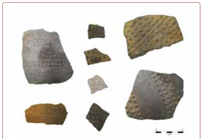
Figura 7. Fragmentos de cerámica de estilo Chimú Negro.

acerca de los restos culturales asociados con cada una de estas fases de ocupación, pero la evidencia estratigráfica subraya la larga y compleja ocupación del Sector 51. Planificamos probar esta secuencia estratigráfica y ocupacional en otras zonas del sitio, incluyendo el Sector 50 (Puente Piedra) donde se ubica un conjunto de arquitectura megalítica. Esperamos también los resultados del análisis por método radiocarbónico de muestras orgánicas recuperadas durante la temporada 2019. Estos fechados ayudarán a definir y entender mejor la cronología de la secuencia estratigráfica y ocupacional en Cerro San Isidro.