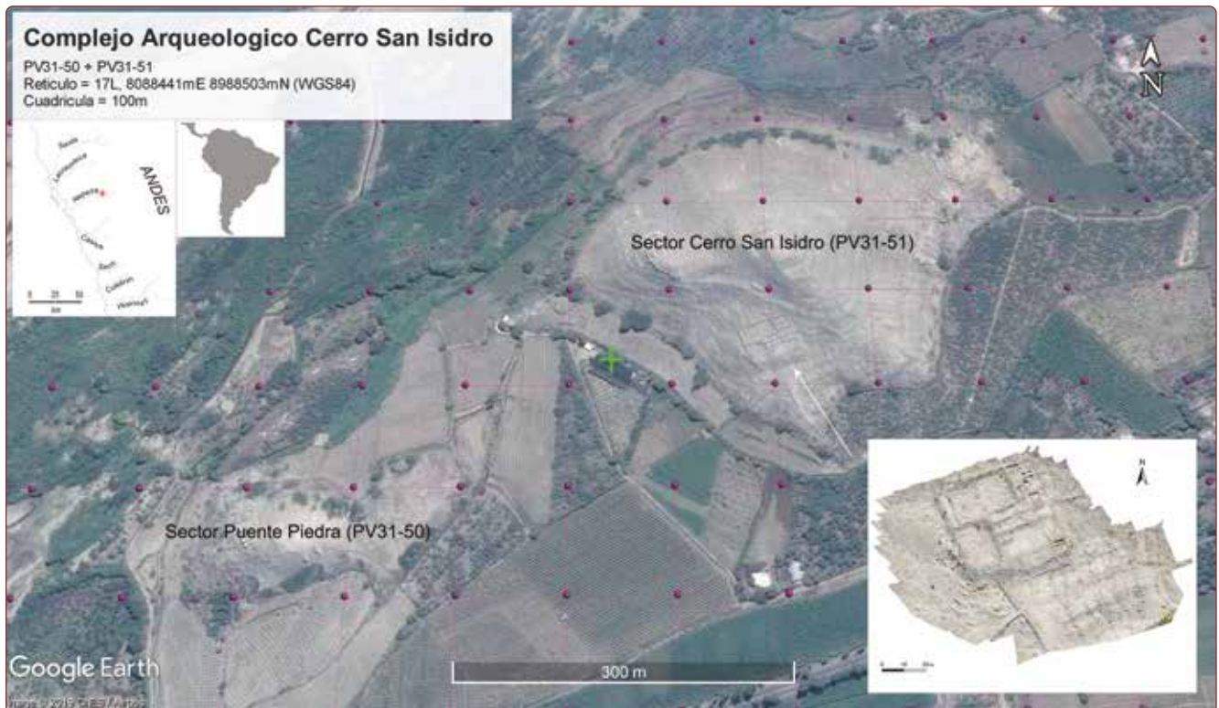
Figura 1. Vista aérea del Complejo Arqueológico Cerro San Isidro mostrando su ubicación en el valle de Nepeña (recuadro izquierdo) y la organización de los sectores Puente Piedra y San Isidro. La ortofotografía en el recuadro derecho muestra la cercadura de piedra investigada durante la temporada 2019 y la ubicación de la Unidad de Excavación 3. Créditos: David Chicoine, Jeisen Navarro y Jacob Bongers.

El Complejo Arqueológico Cerro San Isidro se ubica a 1 kilómetro al oeste de la ciudad de Moro (UTM 17L, 8988607E 808631S [WGS84], 490 metros sobre el nivel del mar) (Figura 1). El complejo fue reportado por primera vez por Donald Proulx (1968), quien lo subdividió en dos sitios (PV31-50 y PV31-51) en base a la presencia de campos de cultivos entre las evidencias arqueológicas. Proulx apunta, sin embargo, que las ruinas de Puente Piedra y Cerro San Isidro están unidas por un muro de piedra. Asimismo, por su cercanía y consistencia en estilos cerámicos y arquitectónicos, PV31-50 y PV31-51 pueden ser agrupados dentro de un solo complejo arqueológico. Proulx (1968: 93) describe las ruinas como cerros naturales sobre los cuales se construyeron cercaduras de piedra. La recolección de superficie de Proulx reportó cerámica diagnóstica del Horizonte Medio y del Período Intermedio Tardío. Richard Daggett también visitó el sitio y reconoció ocupaciones más antiguas (atribuye estas ocupaciones a su fase Horizonte Temprano 1) (Daggett, 1984: 206).