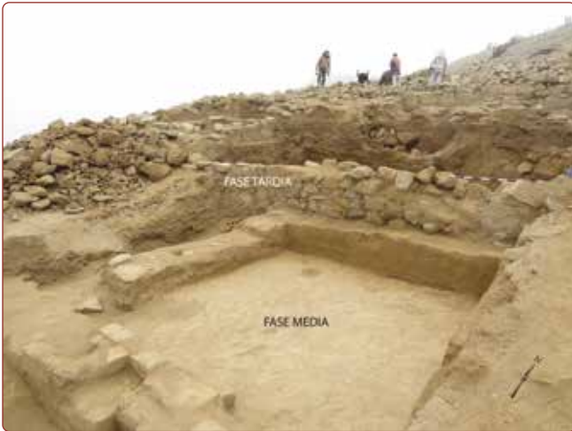
Figura 2. Unidad de Excavación 3D mostrando la superposición arquitectónica de las fases media y tardía.