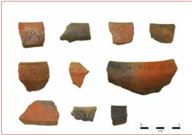
Figura 4. Fragmentos de cerámica con decoración de círculo y punto estampado.